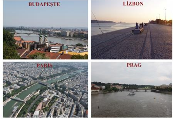
Şekil 1 İçinden nehir geçen bazı dünya kentleri (Özgün)

Kültürel değerlerin sürdürülebilirliği konusunda ileri bir anlayışa sahip Avrupa kentlerinde kullanılan donatı elemanı örnekleri Şekil 2’de verilmiştir. Barcelona’da aydınlatma elemanı ve çeşme, Madrid’in simgesi olan heykelin diğer donatılarda kullanımı ve Lizbon’da zemin kaplaması örnekleri kentin tarihi-kültürel özelliklerini ve kimliğini vurgulamaktadır.