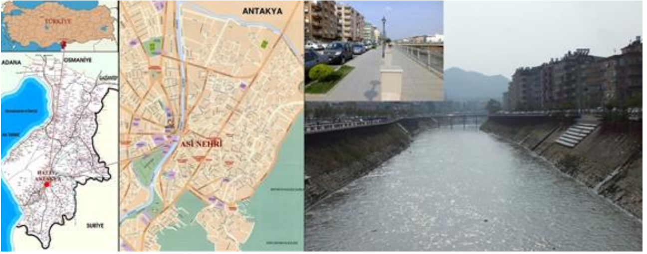
Şekil 3 Araştırma alanının konumu ve görünümü