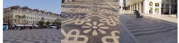
Şekil 2 Barcelona, Madrid ve Lizbon kentlerine kimlik kazandıran donatı elemanı örnekleri (Özgün)